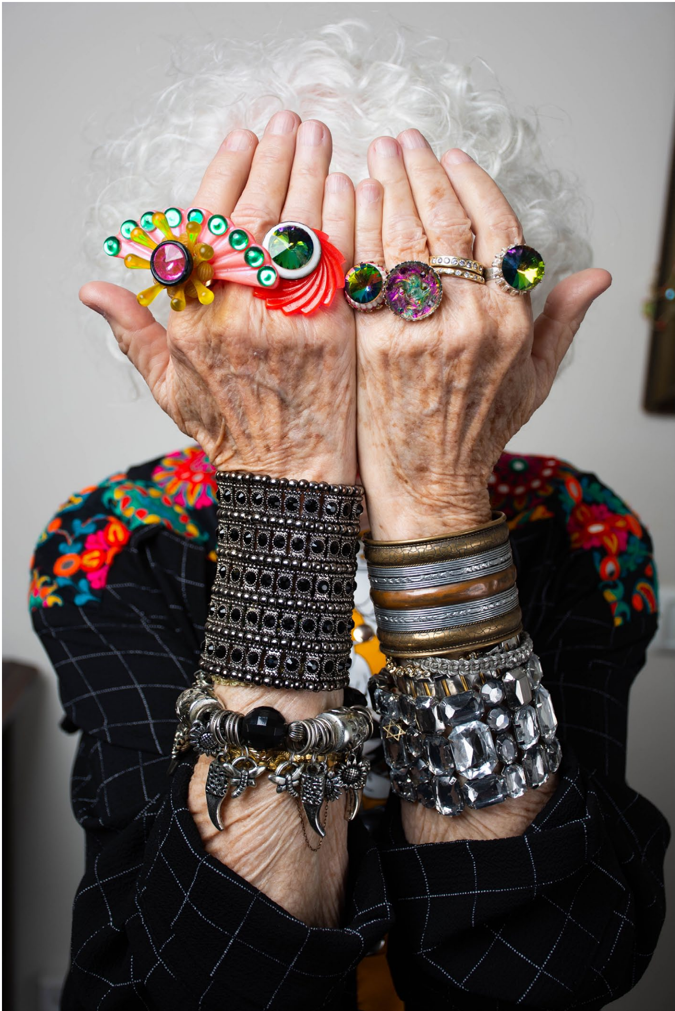
איפור: היבה מחאמיד ע'