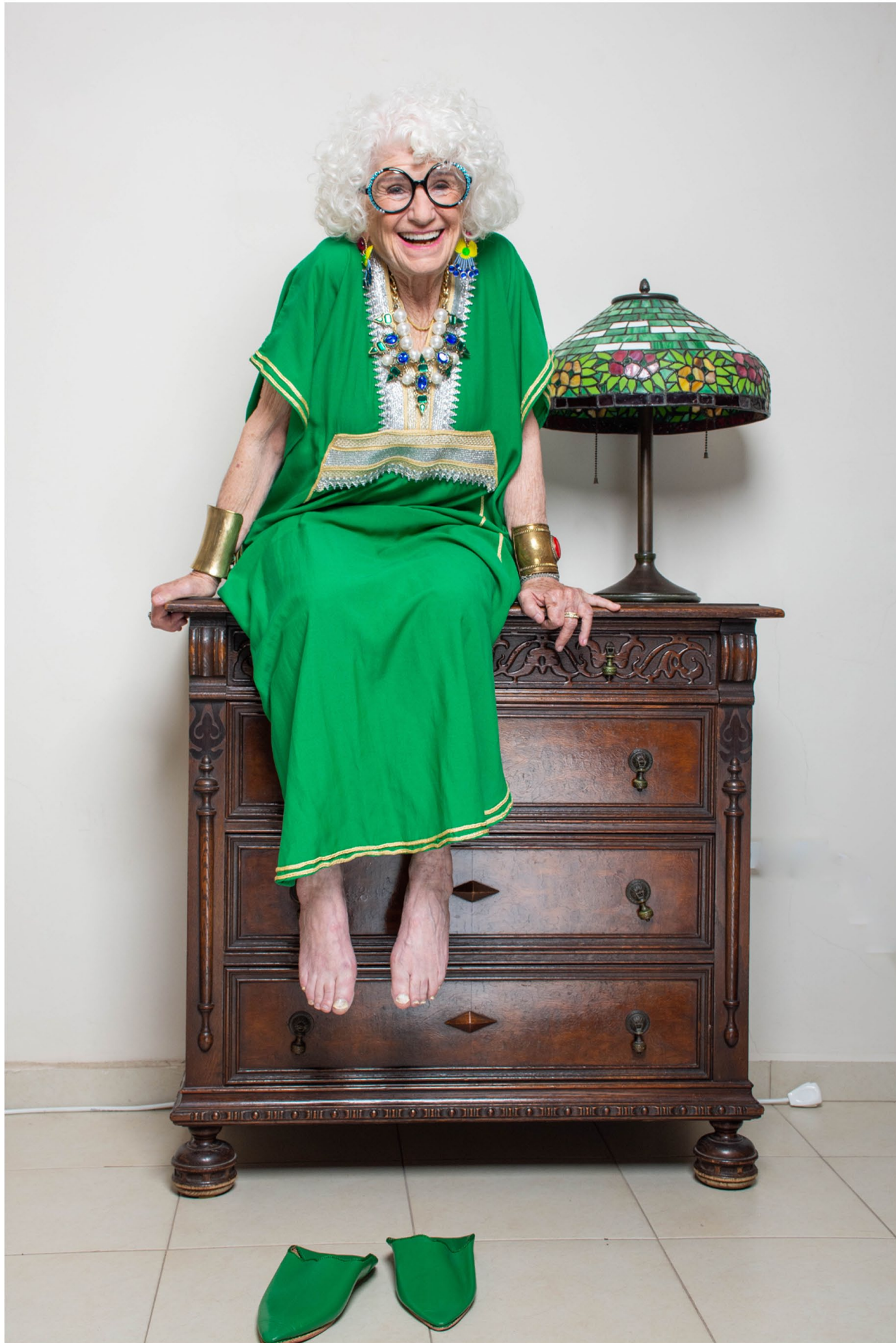
גלבייה: אוסך פרטי, משקפיים: @stedoofashion, תכשיטים: אורטל בן דיין ואוסך פרטי, נעליים: Arabesque