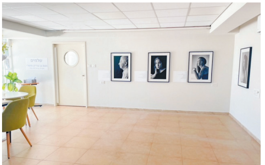
התערוכה בבית רשות הרבים