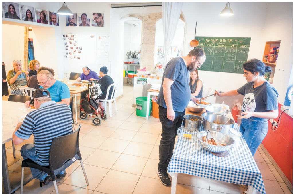
חדר האוכל של הקלאבהאוס בירושלים

כחלק מפעילות המקום, הקלאבהאוס מסייע להכיר להשתלב בשוק התעסוקה באופן מדורג ומותאם.